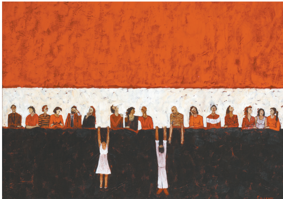
A veces cambio, a veces no 1. Acrílico sobre tela.

G.C.: —Las grafías y palabras escritas aparecieron muy recientemente en mi obra, porque este año, gracias a una convocatoria, comencé a trabajar en libros de artistas. Entonces surgieron las grafías como una necesidad expresiva, para poder