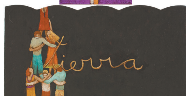
Me pongo en tu lugar. Acrílico sobre tela.