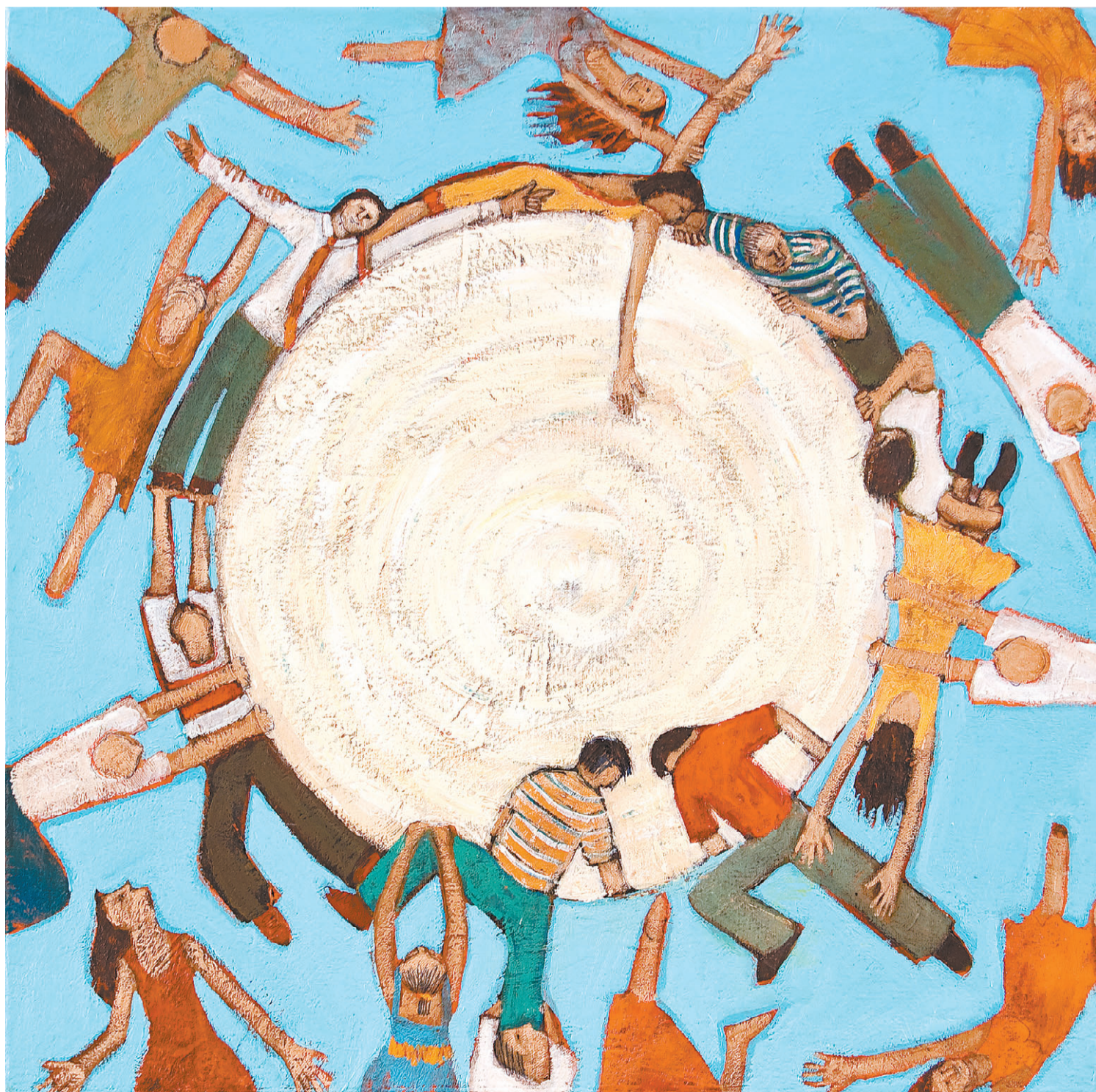
Cíclica. Acrílico sobre tela.

como caligrafías incomprensibles, como huellas, como trazas, surcos o palabras que apoyan el relato. A veces resultan legibles y a veces solo funcionan como elementos puramente visuales.